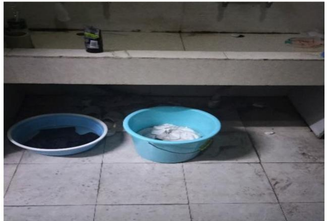
3319: 职教系22级电商班 (辅导员: 张子杰)